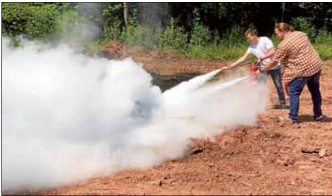
Nach der Übung mit dem gasbefeuelten Übungssimulator wurde auch "echtes" Feuer gelöscht.