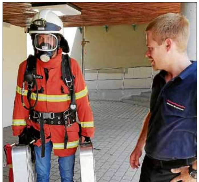
Der Schulleiter probiert die Schutzausrüstung