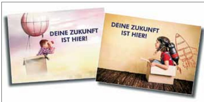
Auszug aus der neuen Werbekampagne der Wirtschaftsförderung des Landkreises Calw.

Wirtschaftsförderung des Landkreises Calw erweitert Angebot der Website www.deine-zukunft-ist-hier.de