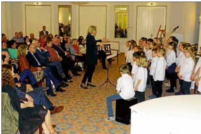
Der Chor der Krokusschule bereicherte die Versteigerung