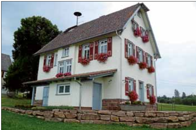
Das Alte Rathaus in Gaugenwald – eines der LEADER-Projekte in der Gemeinde Neuweiler.